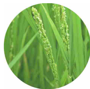
(左) コシヒカリに Hd1 、 Hd5 を入れたイネ。それぞれ早生・晩生になる。 (上) 穂が出ているイネ。